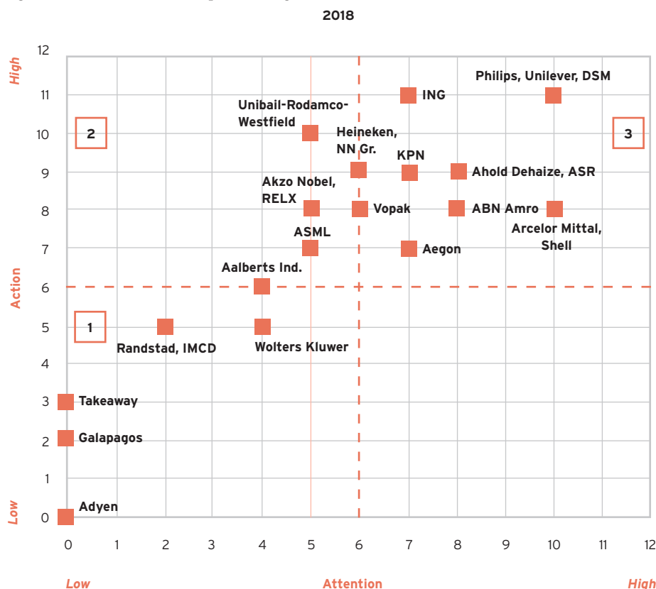
Figuur 2. Jaar 2018 aandacht- actie positionering

dat veel bedrijven nog steeds weinig aandacht geven aan het klimaat in hun communicatie met aandeelhouders en investeerders. In het verlengde hiervan valt op dat maar bij 9 AEX-bedrijven (36 procent) het klimaat op de agenda van de raad van commissarissen staat. Klimaat lijkt daardoor vooral een zaak van de CEO en het executive managementteam.